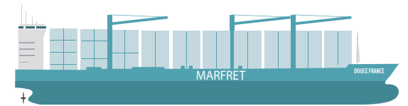
PORTE-CONTENEUR TYPE DOUCE FRANCE 2300 TEUS